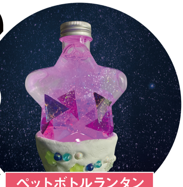
ペットボトルランタン